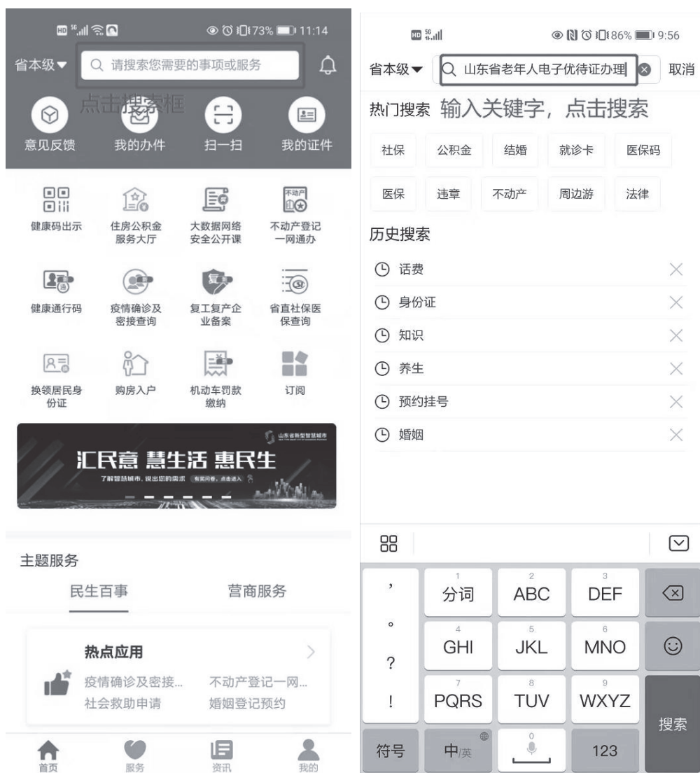
图1 老年人电子优待证办理入口